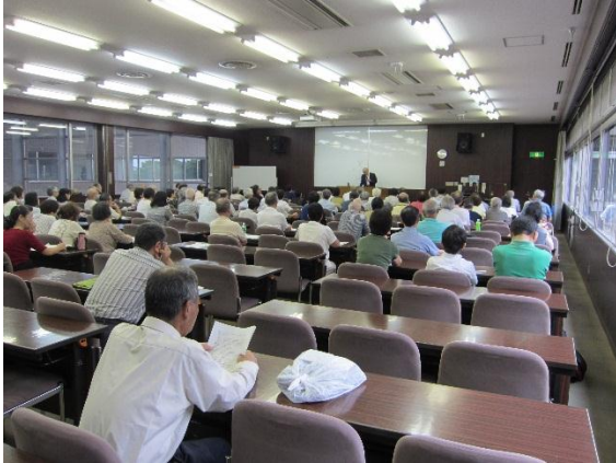
ユーモアあふれる講義で和やかな雰囲気