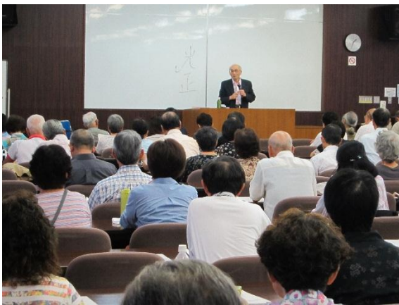
豊富な知識と愉快なお話に引き込まれる