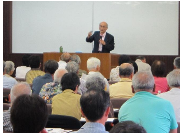
プラス思考(笑い)の考え方に聞き入る皆さん