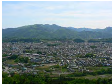
ミュージアパーク